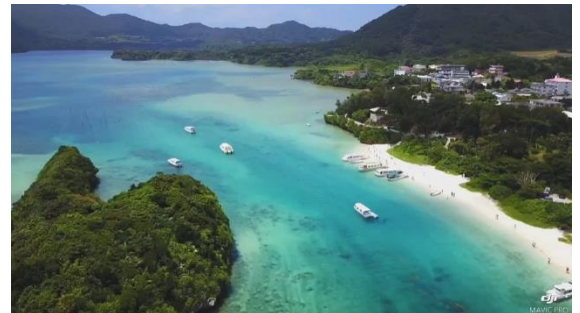
ドロサツ!!利用者インタビューより 「家族旅行で初めてのドローン」