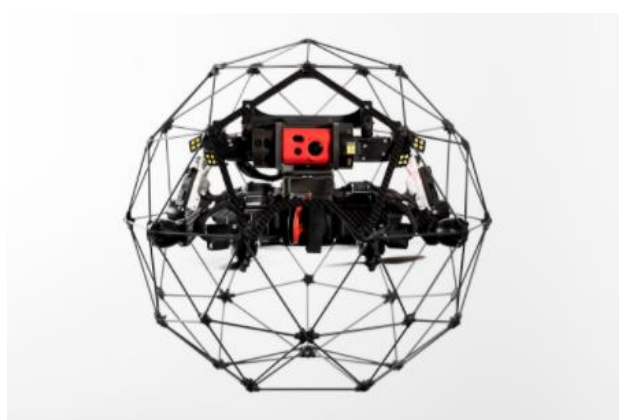
屋内点検向け球体ドローン「ELIOS 2」外観