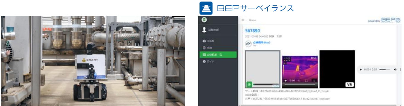
施設内を自動巡回する AGV (左) と「BEP サーベイランス」の管理画面 (右) のイメージ

今回、ブルーイノベーションが開発した、複数のドローンやロボット、各種デバイスを毎回複雑な設定や操作をすることなく一つの指示で自動的に業務を達成できる「Blue Earth Platform® (BEP)」※ 1 をベースとした「BEP サーベイランス」※ 2 と、トッパンフォームズの、IC タグやシステムを最適な構成で提供可能な IoT ソリューションのノウハウを組み合わせることにより、点検担当者の負荷を軽減する自動巡回点検ソリューションを実現しました。